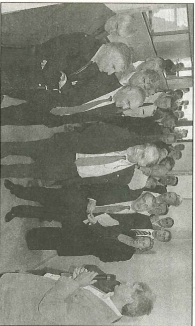
Arcelor a versé 300 000 euros dans ce projet.

Il y a dernière réunion du comité de pilotage pour la reconversion économique, vendredi, à l'hôtel communal d'Artois-Flandres. Ensuite, le préfet, le sous-préfet et la délégation d'élus se sont rendus zone d'activités du Mont-de-Cocagne, pour inaugurer la pépinière d'entreprises d'Isbergues.